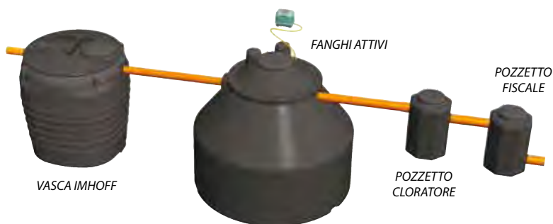
TABELLA 3 SCARICO IN ACQUE SUPERFICIALI