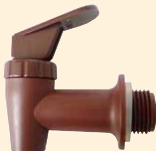
Rubinetto 1/2" PP Cod. RUBINET. 1/2" PP.