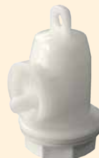
Valvola a doppio effetto in PE Cod. VAL.A DOPPEEF.