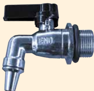
Rubinetto 3/4" Inox Cod. RUB. 3/4